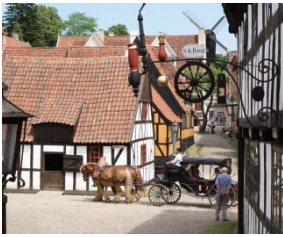
Den Gamle By